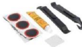
rustines, colle, démonte-pneus