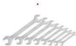
clés plates (tailles 6 à 17)